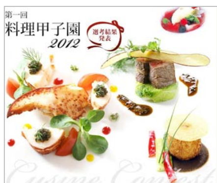
料理甲子園メインビジュアル