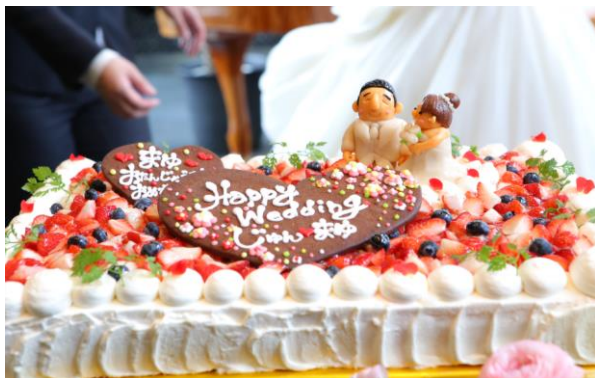
↑ 新郎さまの手作りケーキ