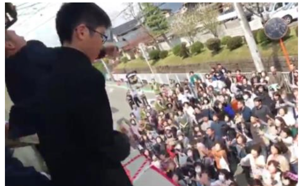
↑ まんじゅうまきの様子