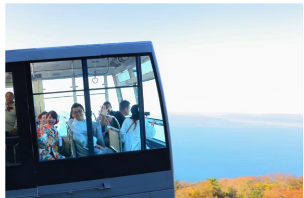
↑ 観光で来られていた方の祝福の声に応えるお二人